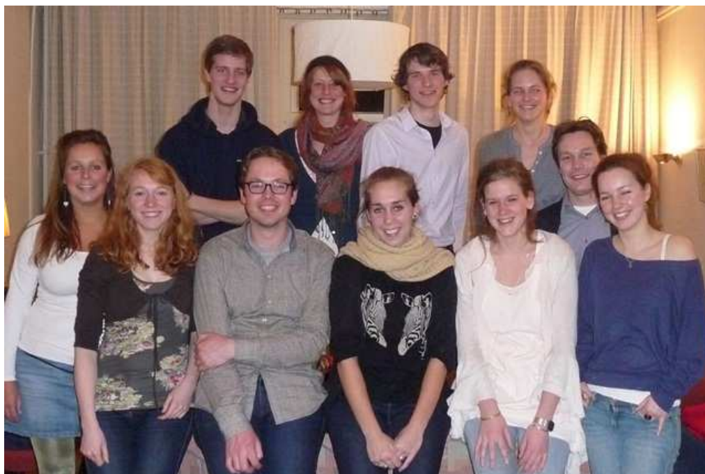
Het team vrijwilligers van SAMEN