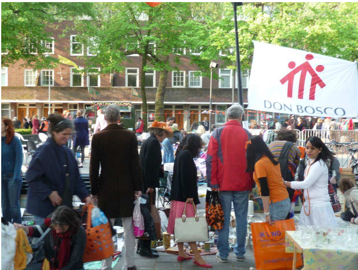
Geld inzamelen voor straatkinderen tijdens Koninginnedag

Wil het naar wens lopen dan moet de organisatie die dag beschikken over zo'n 20 tal vrijwilligers. Een unieke kans b.v. voor deelnemers aan de groepsreis Samen naar Afrika 2010 zich actief in te zetten om sponsorgeld binnen te halen voor de projecten die ze gaan bezoeken tijdens de zomer van 2010. De jongeren hebben met veel plezier hun bijdrage geleverd aan het verkopen van spullen en het toilet in het Don Bosco-huis tegen een kleine bijdrage ter beschikking te stellen voor mensen die daar gebruik van wilden maken. Er is heel wat geld opgehaald voor de projecten in Kenia en Oeganda die de jongeren in de zomer bezocht hebben.